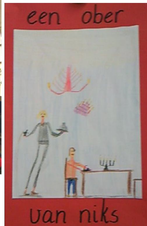
Max uit M2